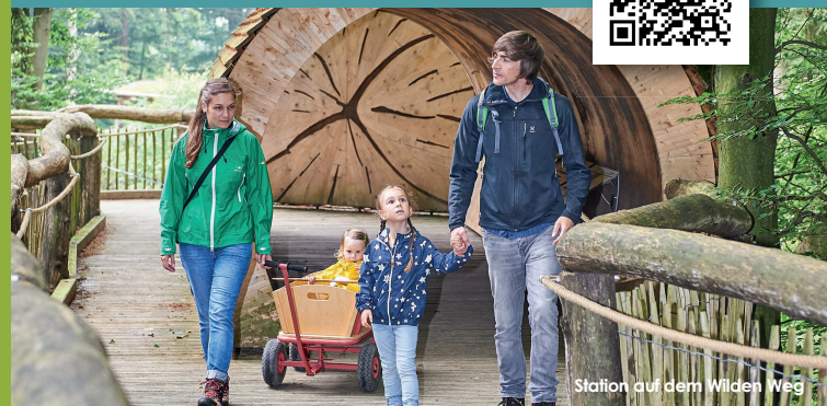
Station auf dem Wilden Weg